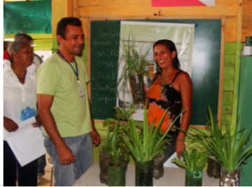
Integrantes do Núcleo de Responsabilidade Socioambiental (Nures).